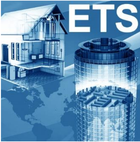
Immagine 1: ETS Inside è intelligente, semplice e sicuro