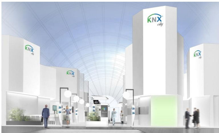
Fig. 1: Mit Sicherheit wieder ein Publikumsmagnet auf der light+building 2014 in Frankfurt: die imposante KNX city in der vielfrequentierten Galleria.

Die marktführende Position von KNX wird auf der weltgrößten Messe für Licht und Gebäudetechnik einmal mehr durch die große Zahl der KNX Mitglieder dokumentiert, die Produkte und Lösungen für die KNX Installation auf ihren eigenen Messeständen präsentieren. Über 180 KNX Mitglieder sind 2014 in Frankfurt mit eigenen Ständen präsent um zu dokumentieren, welche Dimensionen von Komfort, Sicherheit und Energieeffizienz sich heute schon mit KNX realisieren lassen.