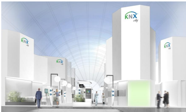
Foto 1: De indrukwekkende KNX city in de drukke Galleria wordt zeker een bezoekersmagneet tijdens light+building 2014 in Frankfurt.

De leidende positie van KNX reflecteert zich ook in het aantal KNX Members met eigen stand tijdens light+building, werelds grootste vakbeurs voor verlichting en gebouwtechnologie, waar ze producten en oplossingen voor KNX-installaties zullen tonen. Op meer dan 180 standen tonen KNX members het comfort, gemak, veiligheid, beveiliging en energie-efficiëntie dat kan worden bereikt met KNX.