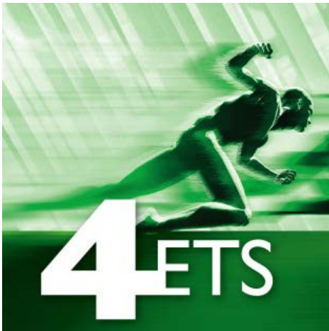
Vyobrazení 2: Nové app rozšiřují funkcionalitu ETS – na výrobku i na výrobci nezávislý nástroj k uvádění do provozu pro všechny KNX projekty.