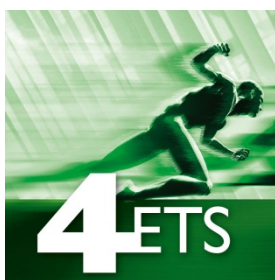
Imagen 2: las nuevas Apps amplían la funcionalidad de ETS: la herramienta utilizada para todos los proyectos KNX independiente tanto de los productos como de los fabricantes.