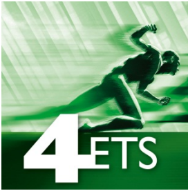
Bild 2: ETS – das produkt- und herstellernerneutrale Inbetriebnahme-Tool für alle KNX Projekte – wird durch die Anbindung der Apps deutlich an Funktionalität gewinnen.